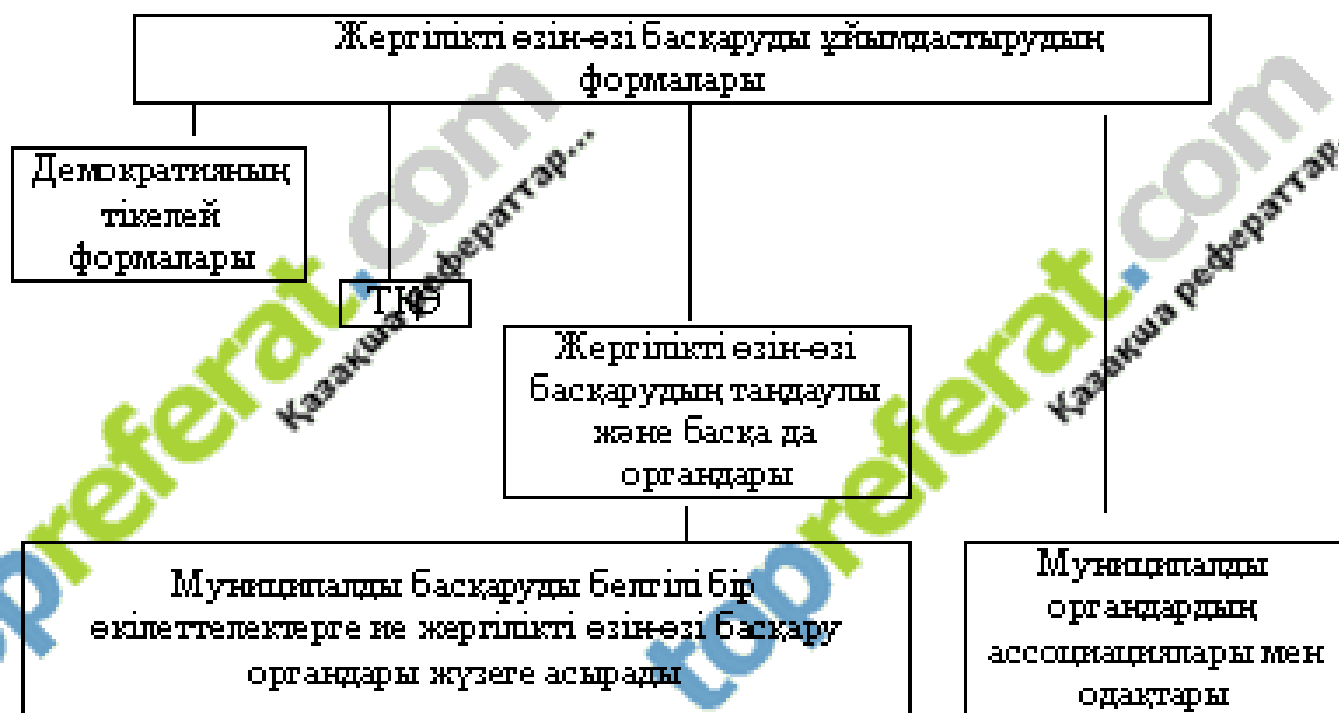
Сурет 1. Жергілікті өзін-өзі басқарудың ұйымдастырудың формалары

Олардың жиынтығы негізінде жергілікті маңызды сұрақтарды шешетін жергілікті өзін-өзі басқарудың біртұтас жүйесін қалыптастырады.